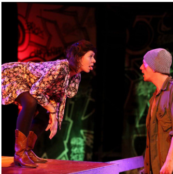
DANNY AND THE DEEP BLUE SEA